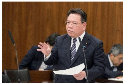
参議院 国土交通委員会での質問