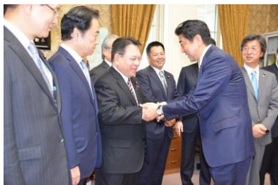
首班指名を終えた総理の挨拶 参議院議員会長室にて