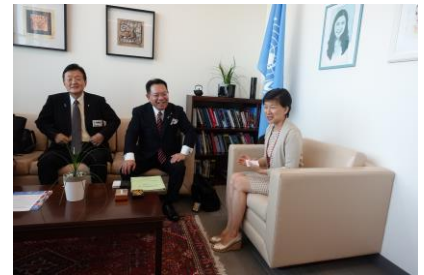
中満 泉 国連事務次長と対談