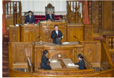
参議院本会議 民法法について質問