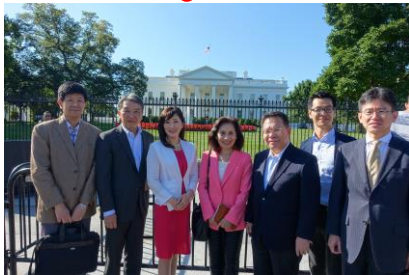
参議院重要事項調査班 団長として アメリカ・メキシコ視察 ホワイトハウス前