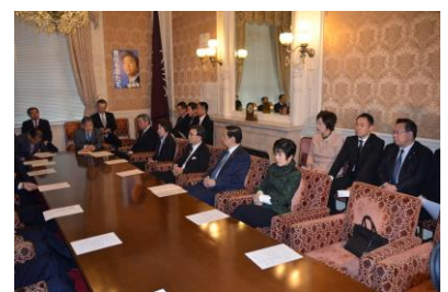
自民党役員連絡会議 副幹事長として出席